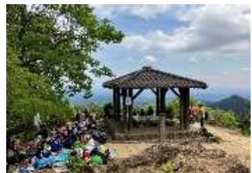
全校遠足(御岳山~日の出山)