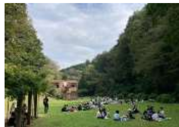
全校遠足(青梅永山丘陵)