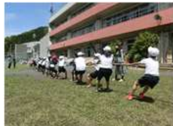
体力強化旬間の取組(全学年)