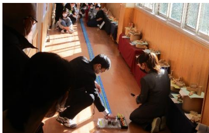
5年1組・ひまわり 算数 速さの実験