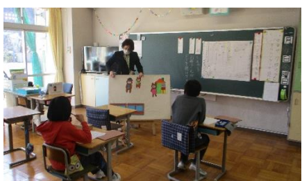
4・5年たんぽぽ 国語 パレシター