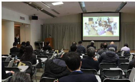
研究発表会 文化会館にて