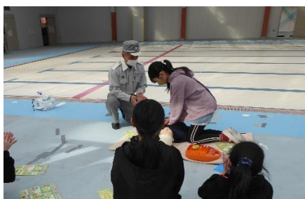
心臓マッサージの実習中 AEDも