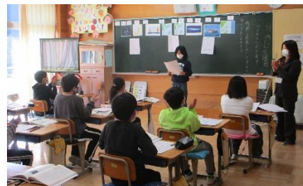
4年1組 国語 ウナギのなぞを追って