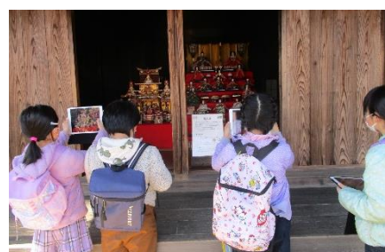
旧宮崎家住宅 お雛様の展示中