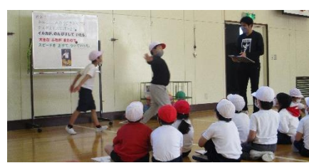
1年1組・たんぽぽ 体育 表現遊び