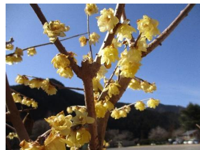
2/28 校長室前 蠟梅

正月に咲き始めた校長室前の蠟梅(ロバイ)が、今も美しい黄色の花を咲かせています。例年よりも冷え込む日が多かったためでしょうか。しかし、すぐそばのアンズの木には、間もなく開花しそうなつぼみがたくさんついています。木々だけでなく、校庭の隅の草花も、間もなく訪れる春に向けてしっかりと準備をしているようです。