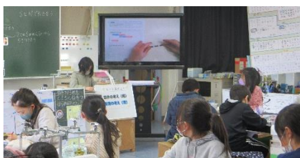
3年1組 理科 じしゃくのふしぎ