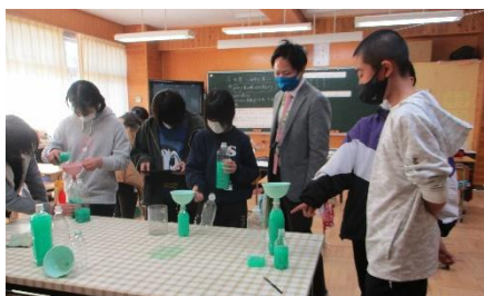
6年1組 算数 和算(油わけ算)

2/9(水)奥多摩町研究指定校研究発表会 奥多摩町の小中学校の職員に2年間の研究の成果を発表しました