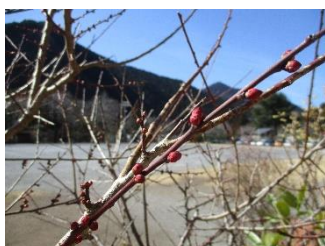
2/28 校長室前 アンズ

大切なことは、「自分で壁を越えていく力」を付けさせること、自分の力だけで越えられない時は、「自分で助けを求める力」を付けさせることだと思います。子供たちは日々成長していますので、大人が思っているより力を付けていることも多いです。壁を越えやすいように手を差し伸べてあげることが、優しさではないこともあります。子供が壁を越えようと精一杯もがいているところをじっと見守ったり、安易に避けないように叱咤激励したりするような厳しさが優しさであることもあります。手を差し伸べるタイミングが、早すぎても遅すぎても良い成長につながりません。そのタイミングは、子供によっても違いますし、発達段階