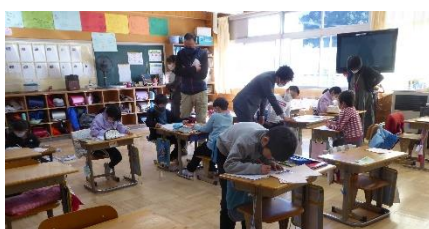
2年1組 国語 題材を集めて詩に