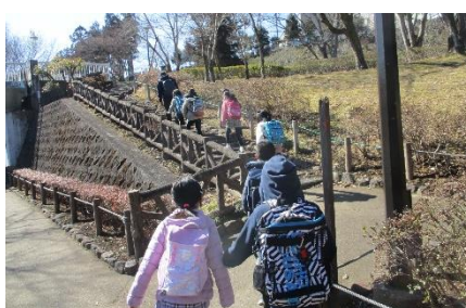
博物館は釜の淵公園内にあります