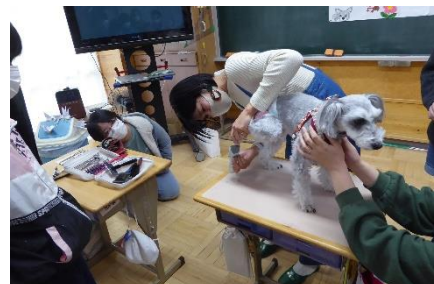
足の裏と爪の手入れのようす