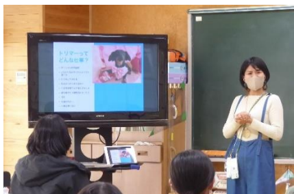
トリマーになった経緯 にこやかに