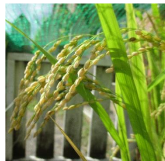
9/29 職員室前 イネ