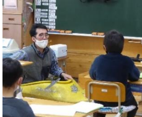
羽尾様 カヌー持参で