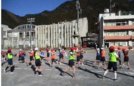
全員でバッティングの練習