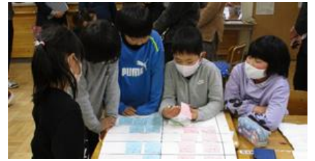
チームに分かれて検討、まとめ