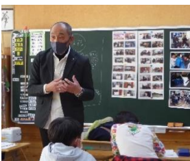
武本様 大切な伝統