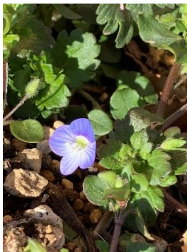
校庭のオオイヌノフグリ 1/29

今年の立春は2月3日です。カレンダーを見て、「えっ、2月3日が立春?」と思いました。調べてみると、立春が2月4日でないのは35年ぶりだそうです。立春といえば暦の上で春が始まる日、今年は例年より春が一日早くやってくるのですね。