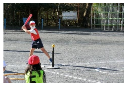
デモンストレーション 4年生