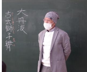
榎戸様 地域で継承