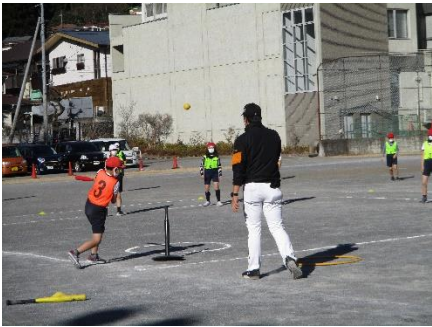
試合開始 けっこう打てます