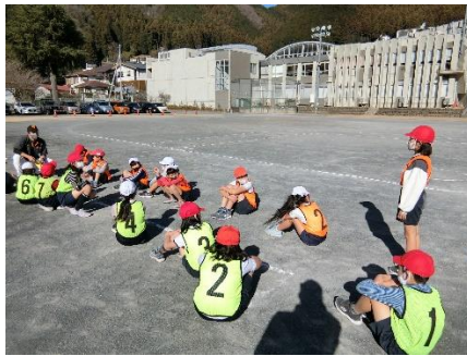
試合後の反省会で4年生が質問