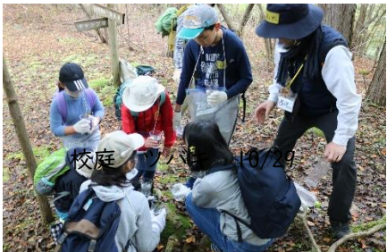
重なった落ち葉の吸水実験

10/22(木)~23(金) 4年 奥多摩移動教室 氷川小の児童と一緒に、山のふるさと村で自然を学びました。