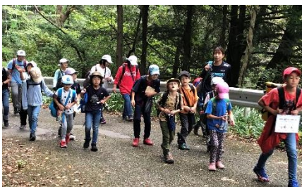
1班 元気に歩き始めました

10/5(月) 全校遠足 奥多摩むかし道 全校で奥多摩駅から小河内ダムまで約10km、歩きました。