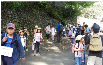
5班 水根沢林道 もうすぐゴール