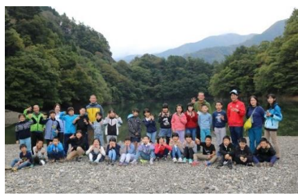
奥多摩湖畔で集合