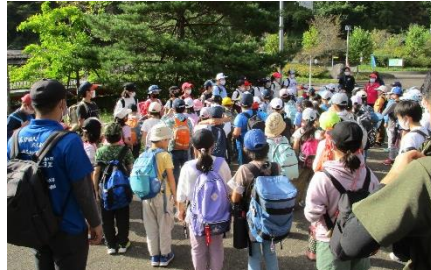
小河内ダムにて 終わりの会