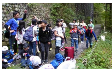
2班 時々休憩しながら歩きます