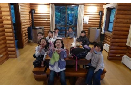
一番大きいケビンはこんな感じです