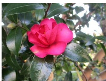
校庭 ツバキ 10/29

感染症対策は、今後も継続していかねばなりません。本校は、何とかしてできる方法を探しながら次年度の計画を立てていきたいと思えます。