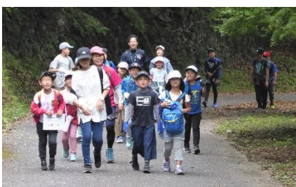
3班 昼食場所は目の前