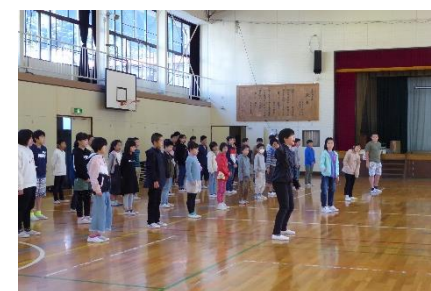
10/29 音読集会 高学年「かく」