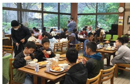
食事はカフェレストランやませみで