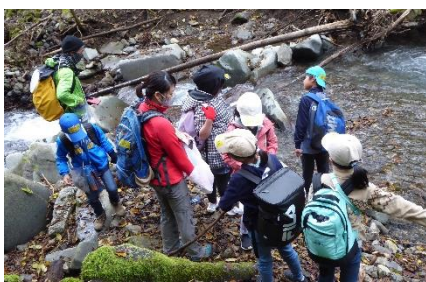
サイグチ沢の水を吸んでいます