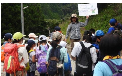
4班 第2チェックポイント クイズ出題