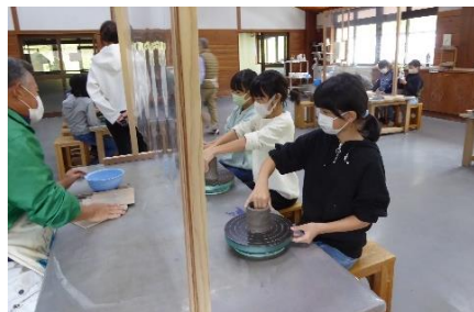
クラフトセンターで工芸体験

10/5(月) 全校遠足 奥多摩むかし道 全校で奥多摩駅から小河内ダムまで約10km、歩きました。