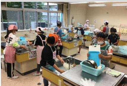
10/9 5年調理実習いもをゆでよう