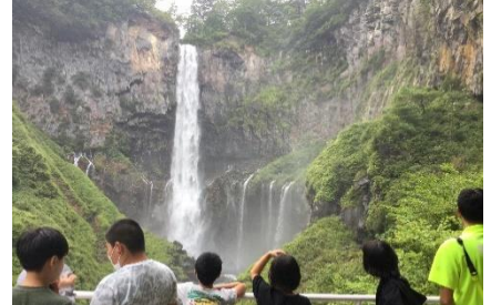
華厳の滝 水量が多いです