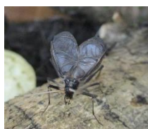
校長室前 スズムシ 8/25

ここで重視されている力は、学校の教育活動全体で育むものですが、本校で2学期に予定している学校行事は、この力を育むために最善の場ではないかと思います。運動会や学芸会、全校遠足など、一人で頑張っても成功しない行事を、得意なことや苦手なことが違う子供たちが、それぞれの良さを発揮したり、苦手なことを補ったりしながら一つのものとしてつくり上げる。そんな経験をする学校行事にしていきたいと思っています。