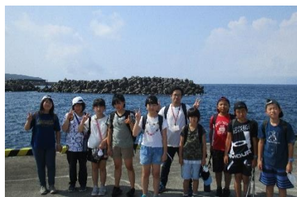
楽しい思い出がたくさんできました