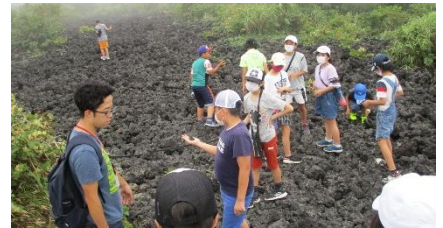
三原山のゴロゴロ溶岩を観察