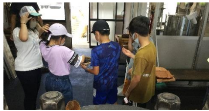
椿油瓶詰め体験 お土産ができました