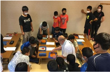
日光彫の体験 職人技に夢中