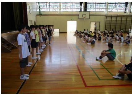
8/21 始業式 4年生の力強い発表