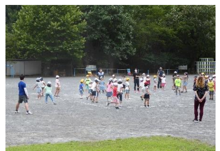
8/27 ロング遊びは4年生中心に