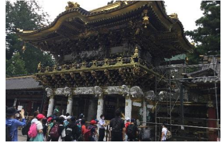
日光東照宮 陽明門の前です

8/26(水)~28(金) 5年 大島移動教室 2泊3日、良い天気の中で大島での体験を行うことができました。