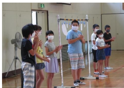
8/25 運動会の色決め集会