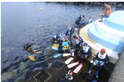
いよいよ海に入ります 気持ちいい!