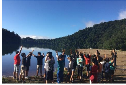
湯ノ湖での朝 皆でトンボ集め!?