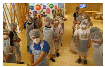
小田原でかまぼこつくり準備万端