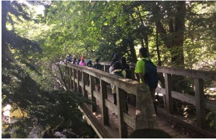
湯ノ湖から戦場ヶ原を巡ります

8/26(水)~28(金) 6年 日光移動教室 氷川小の児童と一緒に、夏の終わりの奥日光を満喫しました。