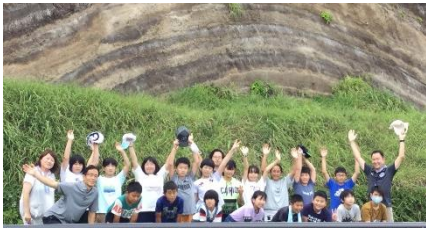
大きい大きい地層の前で

8/26(水)~28(金) 5年 大島移動教室 2泊3日、良い天気の中で大島での体験を行うことができました。