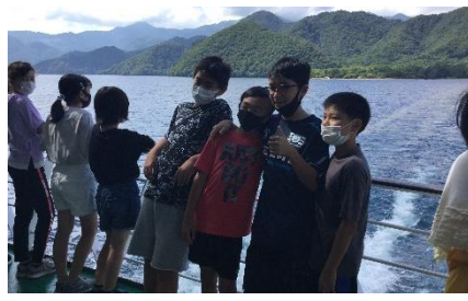
船で中禅寺湖の上 風がさわやか