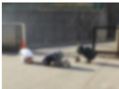
避難訓練(地震想定)