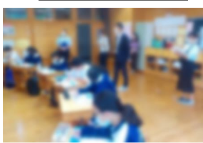
道徳授業地区公開講座